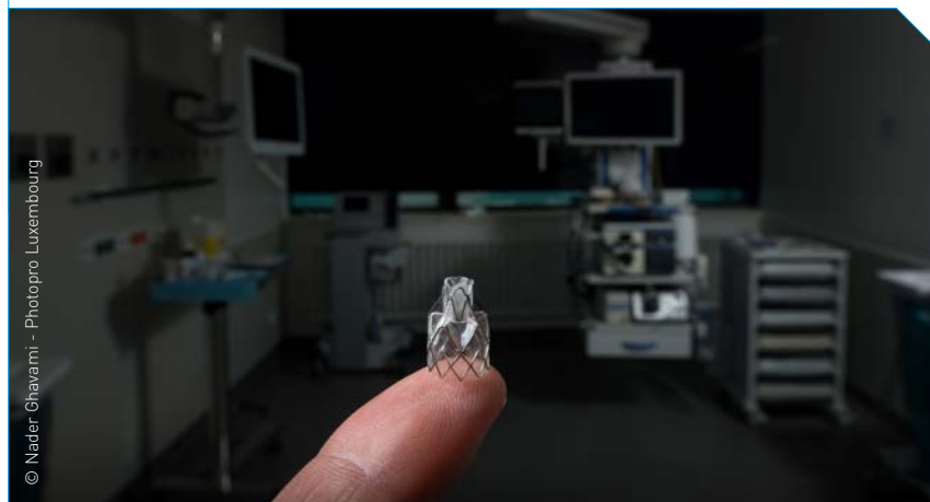
Figure 2: Valve endobronchique Zephyr®

L'intervention dure généralement un peu plus d'une heure et est techniquement aisée pour tout endoscopiste expérimenté. Les valves sont placées «à vie», et leur présence est totalement imperceptible pour le patient.