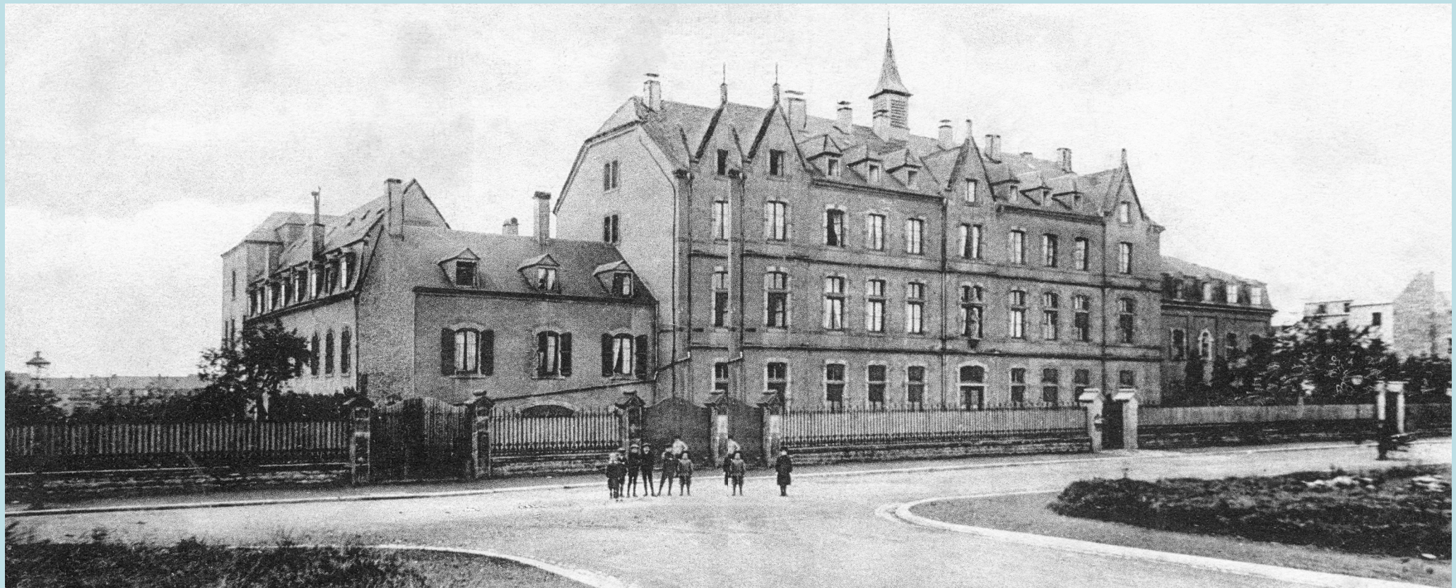
Die ZithaKlinik prägt seit Jahrzehnten das Bild des „Garer-Quartier“.