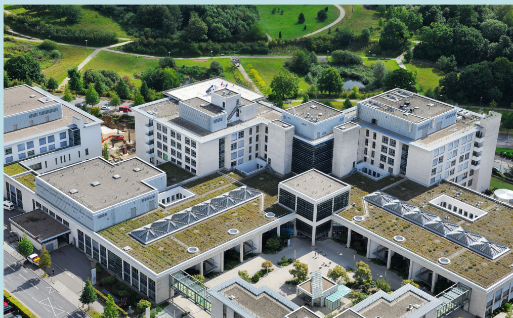
Juli 2003: Das „Hôpital Kirchberg“ wird eröffnet. (2014)

Auf der Suche nach neuen Talenten und um die Krankenpflege und das Niveau der Pflege weiter zu erhöhen und ganz in der Philosophie des „life-long learning“ und des Verbessern, eröffnet der HRS 2006 sein Training-Center: Nachhaltigkeit und Exzellenz sind in unserer DNA seit eh und je verankert. Um unseren Patienten die bestmögliche und menschenwürdigste Pflege zu erleichtern, baut das HRS seine Kapazitäten im Bereich der ambulanten Onkologie/Chemotherapie aus und wird 2007