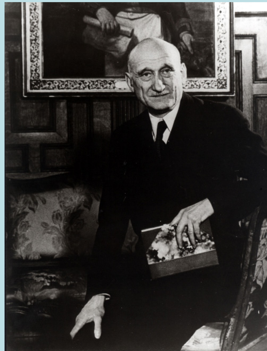
Robert Schuman - in Luxemburg geboren, für Europa gelebt.

Robert Schuman steht für die Öffnung zu Europa, eine historische Nähe zur gesamten Großregion, in der Grenzen verschmelzen und Identitäten miteinander koexistieren. Schuman - ein Mann mit starken christlichen Werten, der es verstanden hat, Verantwortung zu übernehmen und dabei Schwierigkeiten erfolgreich überwinden konnte, ähnlich wie all jene Ordensschwwestern, die in unseren historischen Vorgänger-Krankenhäusern Verantwortung übernahmen, für die Krankenpflege einerseits, aber auch um sich um das Wohl der gesamten Bevölkerung der Stadt Luxemburg zu kümmern.