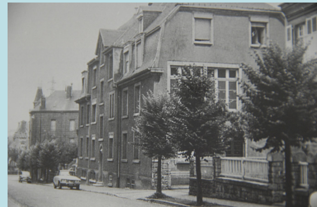
— Das Ste-Marienkrankenhaus in Esch-sur-Alzette (1966)