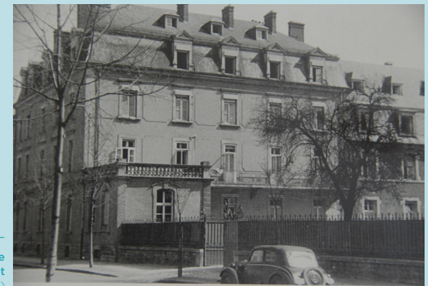
— Die hauptstädtische Clinique Ste-Elisabeth wurde 1899 gegründet (1926)